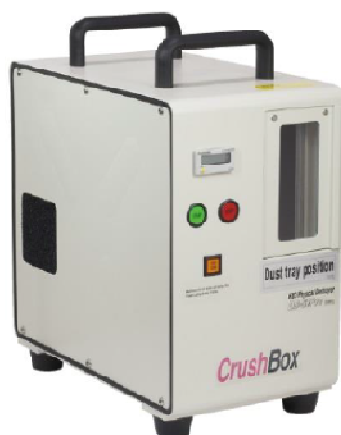
CrushBox DB-30Pro II

1回あたり10秒程度で穴開け処理をするため、大量のハードディスク破壊にも対応できます。