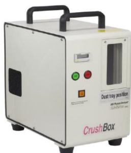
CrushBox DB-30Pro II

1回あたり10秒程度で穴開け処理をするため、大量のハードディスク破壊にも対応できます。